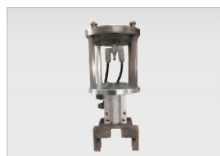
チャック型ハンド (ツールチェンジャー対応)