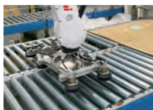
段ボールを畳むハンド